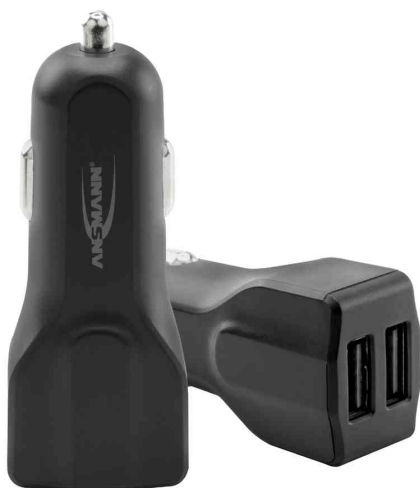
USB-KFZ-Ladegerät "In-Car Charger 248", 2-fach