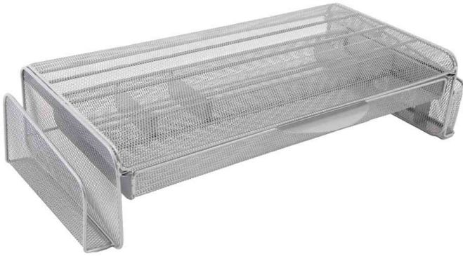
Monitorständer MESHUP M, grau