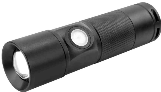
LED-Taschenlampe Future T350FR