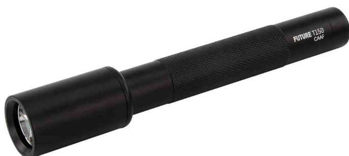
LED Taschenlampe Future T150