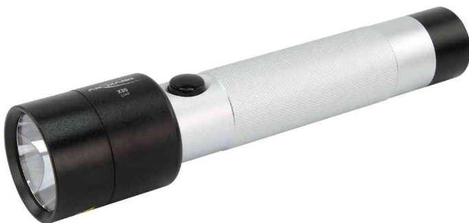
LED Taschenlampe X30