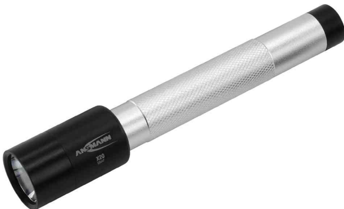
LED Taschenlampe X20