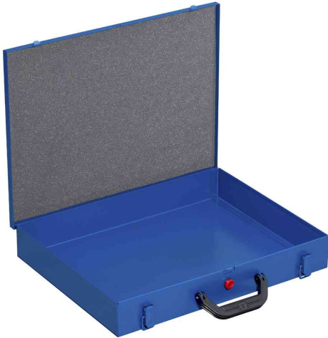
EuroPlus Pro M 44H-1

- zum Sortieren von Werkzeugen, Schrauben, Kleinteilen