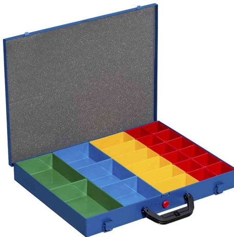
EuroPlus Pro M 44L-23