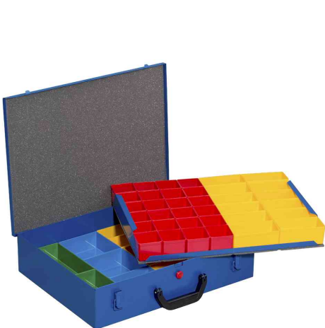
EuroPlus Pro M 44H/2L-59