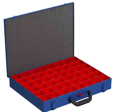
EuroPlus Pro M 44H-48