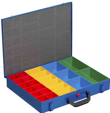
EuroPlus Pro M 44H-23