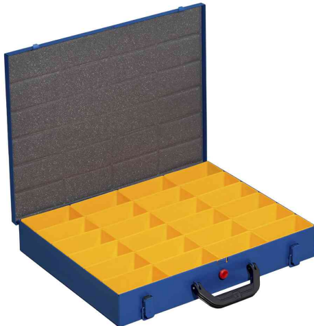
EuroPlus Pro M 44H-24