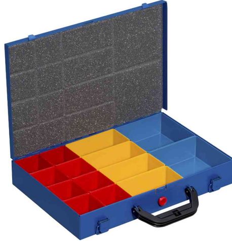
EuroPlus Pro M 34L-14