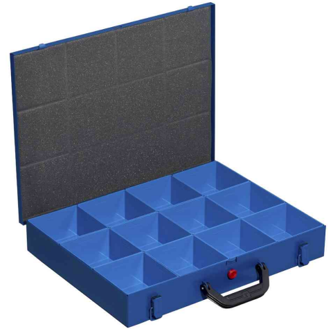
EuroPlus Pro M 44H-12