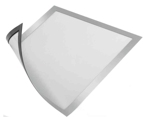
Magnet-Rahmen DURAFRAME MAGNETIC, silber