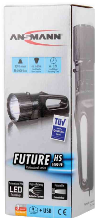
LED-Handscheinwerfer "Future HS100FR" - in Umverpackung