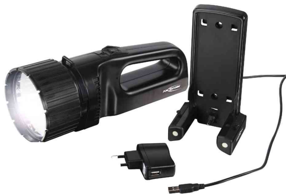
LED-Handscheinwerfer "Future HS100FR" mit Ladestation