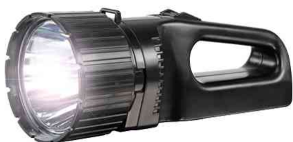
LED-Handscheinwerfer "Future HS100FR"