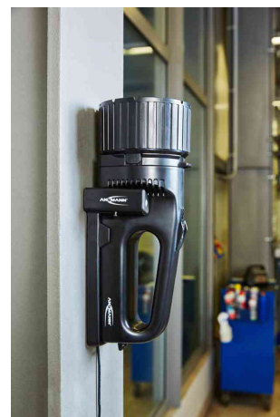
LED-Handscheinwerfer "Future HS100FR" - Anwendungsbeispiel