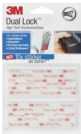
Dual Lock Klett-Power SJ3560