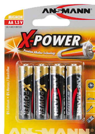
Alkaline Batterie "X-Power" Mignon AA, 4er Blister