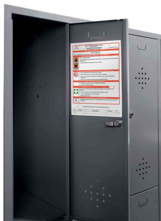
Anwendungsbeispiel: Befestigung von Sicherheitshinweisen