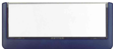
Türschilder Click Sign, blau