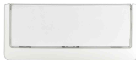
Türschilder Click Sign, weiß