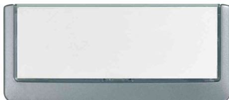
Türschilder Click Sign, graphit