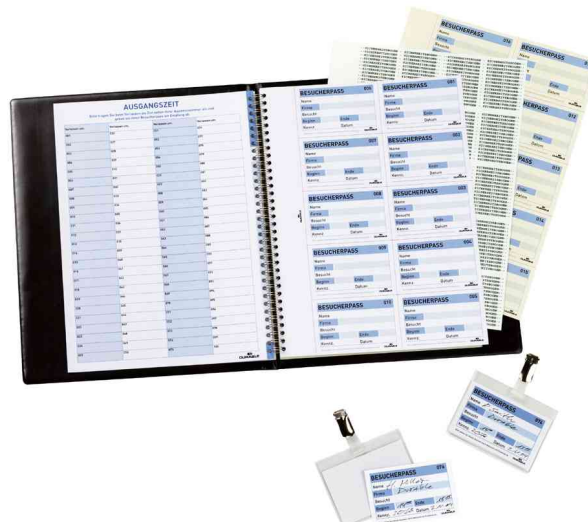
Besucherbuch VISITORS BOOK 100, offen