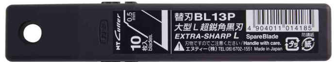
Verpackung Ersatzklingen BL13P