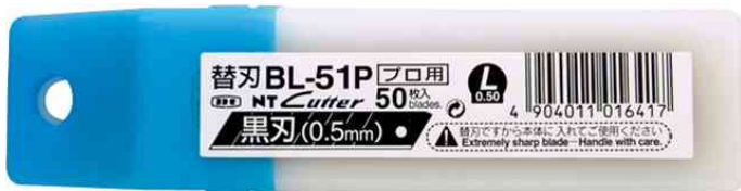
Verpackung Ersatzklingen BL-51P