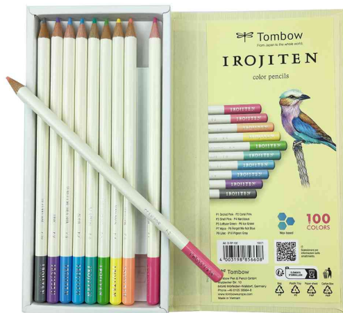
Buntstifte IROJITEN "Volumen 1", 10er Set