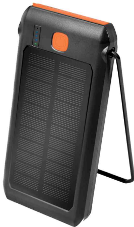
Mobiler Zusatzakku mit Solar