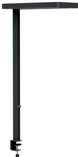
LED-Tischleuchte MAULjuvis, mit Klemmfuß, schwarz