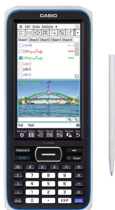
Grafikrechner FX-CP400 (ClassPad II)