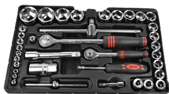
Werkzeug-Satz: 1. Fach