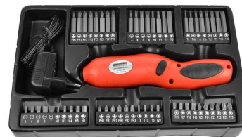
Werkzeug-Satz: 4. Fach