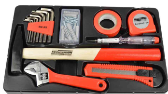
Werkzeug-Satz: 2. Fach