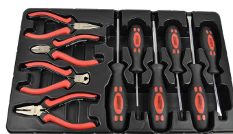
Werkzeug-Satz: 3. Fach