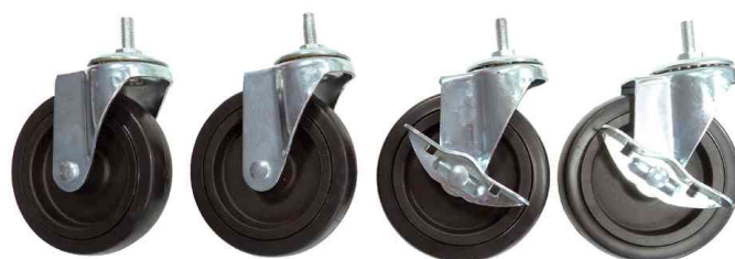
Räder-Set für Multifunktionsregal MOBI