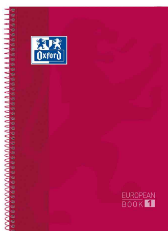
European Book "Classic", rot