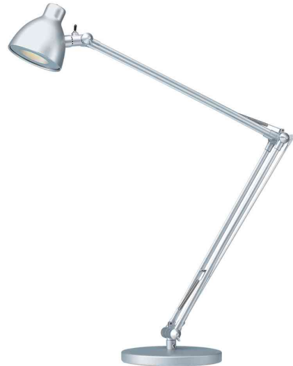
LED-Tischleuchte Valencia, silber