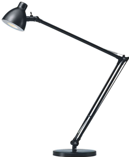
LED-Tischleuchte Valencia, schwarz