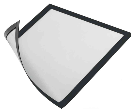
Magnet-Rahmen DURAFRAME MAGNETIC, schwarz