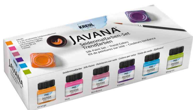
Seidenmalfarbe JAVANA, Trendfarben-Set