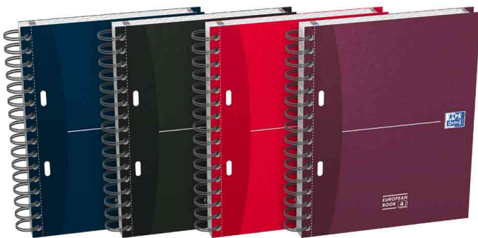
Collegeblock Essentials "European Book 4"