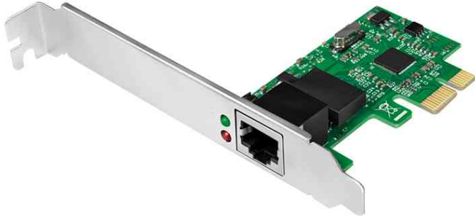
PCI Express Gigabit Ethernet Netzwerkadapter

- zur Anbindung eines PC's in ein Netzwerk