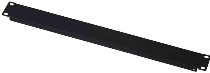
19" Blindplatte, 1 HE