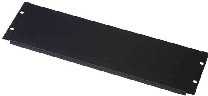
19" Blindplatte, 3 HE