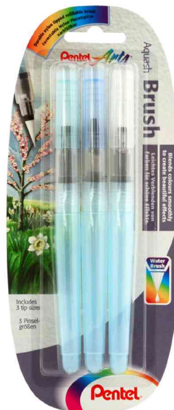
Aquash Pinselstift, 3er Set