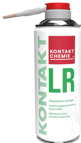
Leiterplattenreiniger "KONTAKT LR"